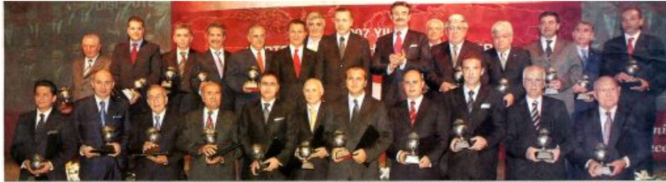
'Dünyanın En Büyük 225 Uluslararası Müteahhidi' arasında yer alan Türk inşaat firmalarına başarı plaketleri Başbakan Erdoğan ve Bakan Tüzmen'in kabildiği törenle verildi