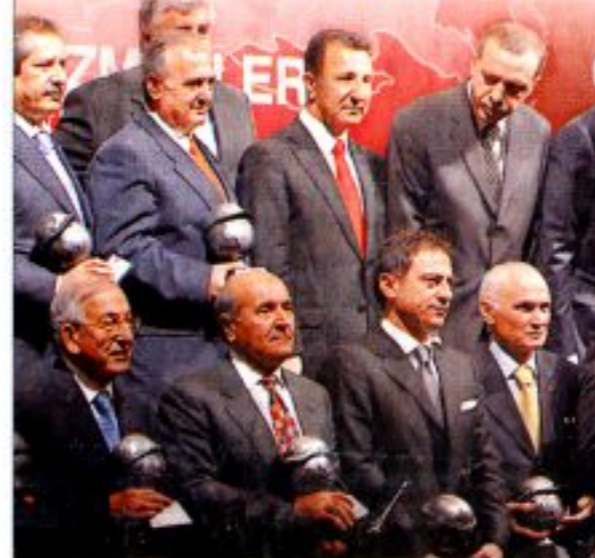
19 Kasım günü düzenlenen törende Başbakan Recep Tayyip Erdoğan dünyanın en büyük 225 uluslararası müteahhirdi arasında yer alan Türk İnşaat firmalarına başlangıç plaketini verdi. Törene Erdal Eren de katıldı.