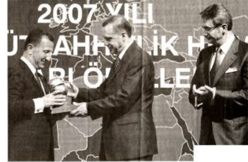
■ Türkiye Müteahhitler Birliği Başkanı Eren Erdoğan, Başbakan Tayyip Erdoğan'a bir plaket verdi. Törende Devlet Bakanı Kürşat Tüzmen de hazır bulundu.