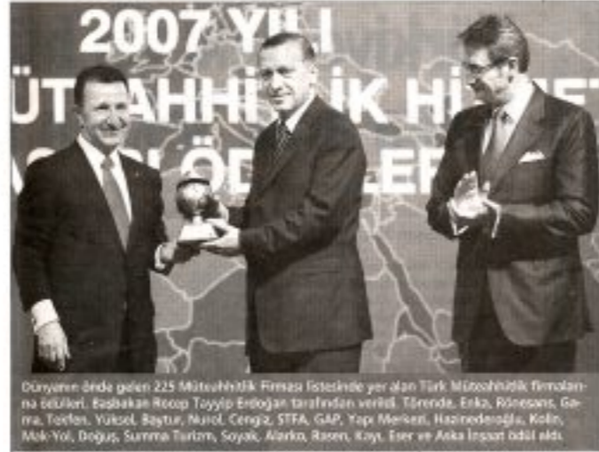
Dünyanın önde gelen 225 Müteahhithlik Firması listesinde yer alan Türk Müteahhithlik firmalarına ödülleri, Başbakan Recep Tayyip Erdoğan tarafından verildi. Törende, Enka, Rönesans, Gema, Teçfen, Yüksel, Baytur, Nival, Cengiz, STFA, GAP, Yapı Merkezi, HazineDenetçisi, Kolin, Mak-Yol, Boğuş, Sunma Turizm, Soyak, Alarka, Razer, Kaya, Ester ve Anka İnşaat ödül aldı.

Başbakan Erdoğan 2006 yılında Türkiye'ye gelen doğrudan küresel sermaye miktarının 20 milyar dolar olduğunu hatırlatarak, "İnsallah, 2007 yılında bu rakam 25 milyar dolara ulaşacaktır" dedi. Buna yönelik itirazların olduğunu belirten Erdoğan, "Ülke elden gidiyor, yabancı sermaye istemiyorsunuz, bunlara benzer yalan yanlış iddialarla savaşı bulandırmaya çalışıyorlar oldu. Ödülkendirliğimiz müteahhitlerimiz, bu aslız iddialara verdiğimiz net cevap: Türkiye, müteahhithlik alanında dünyanın en gelişmiş ülkeleri. Kendi iş adamımız orada bu başarıyı gösterirken bizim küresel sermayeye sınırlanmış kapatılmamız söz konusu bile olamaz" diye konuştu.