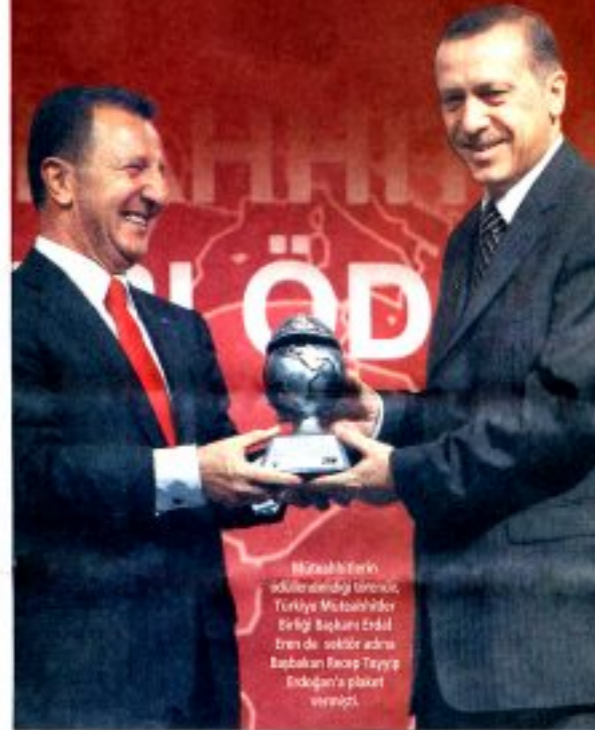
Müteahhirlere ödül verildiği törende, Türkiye Müteahhirlere Birliği Başkanı Erdal Eren de sektör adına Başbakan Recep Tayyip Erdoğan'a plaket veriyor.

Müteahhirlere Birliği Başkanı Erdal Eren, 'Bize taşeron olamayanla aynı ihaleye teklif veriyoruz. 50 liralık işe 25 lira diyor. Oysa herkes işin o fiyata yapılamayacağını biliyor. Ancak birle-ri göz yumuyor' dedi.